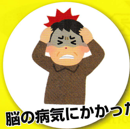
脳の病気にかかった