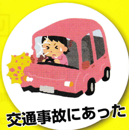
交通事故にあった