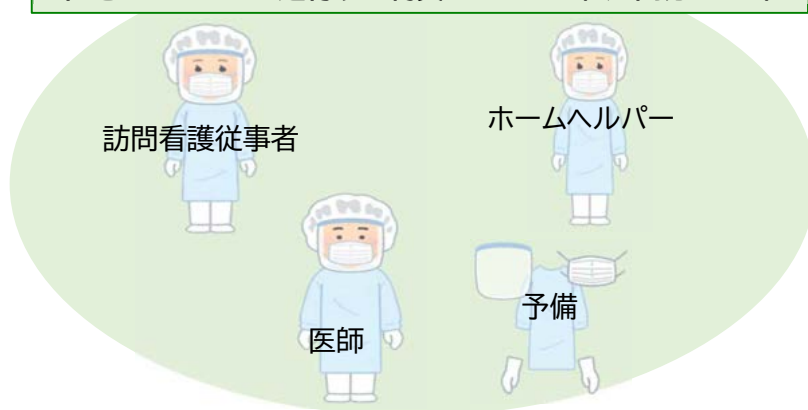
在宅ケアチームに送付する物資のイメージ(1週間分セット)